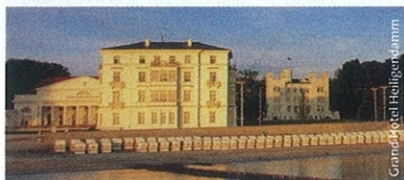
Heiligendamm – Tagungsort für den „Keramik-Gipfel“

LEIPZIG – Am 30. April und 1. Mai findet in Heiligendamm der Keramik-Gipfel von absolute ceramics mit Top-Referenten statt.