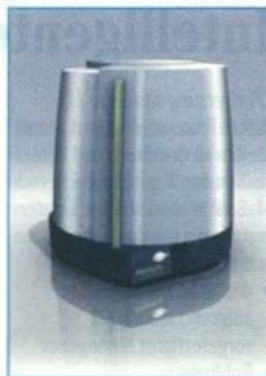
Abb. 1: Der Matchpoint-Scanner von Absolute Ceramics

Entscheidend für den optimalen Sitz der gefrästen oder geschliffenen Restauration ist aber nicht allein die Scangenaugigkeit. Erst die perfekte Abstimmung der CAD/