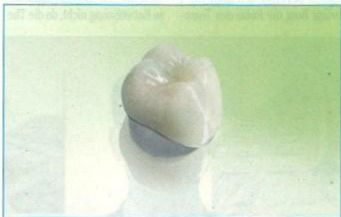
Abb. 6 und 7: Hohe Stabilität und keramische Ästhetik für kostenbewusste Patienten: Titangerüst mit einer Verblendung aus Feldspatkeramik als Brücke im Fertigungsstand „as machined“ und als fertiggestellt Infix -Krone.