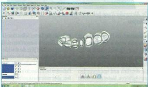
Abb. 8: Übersichtsscan, Einzelstümpfe und Bissregistrat zur Darstellung der Gegenkieferbeziehung und der statischen Okklusion werden mit 500.000 bis 750.000 Bildpunkten pro Minute digitalisiert und anschließend vollautomatisch zu einem kompletten Datensatz zusammengesetzt.