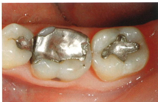
Abb. 1 Bei der Verwendung von Amalgam als Füllungswerkstoff bleibt immer ein fader Beigeschmack. Bis zum Jahr 2011 soll eine weltweite Verordnung zum Quecksilberverbot umgesetzt werden

Nun gehört Amalgam nicht unbedingt zu den aufklärungspflichtigen Stoffgruppen in Deutschland. Dennoch bleibt ein fader Beigeschmack. Immerhin wird es wegen seines Quecksilberanteils als hochtoxischer Sondermüll entsorgt und Zahnärzte müssen strenge Vorschriften bei der Verarbeitung einhalten. Auch auf internationaler Ebene wird über mögliche Gesundheitsfolgen quecksilberhaltiger Zahnfüllungen diskutiert, denn bereits geringe Dosen von Quecksilber können durch Anreicherung im Gehirn, Nerven und Organen schädigen. Auf dem UN-Gipfeltreffen in Nairobi wurde ein weltweites Verbot für Quecksilber beschlossen. Der Beschluss soll